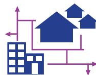
Réseaux de chaleur